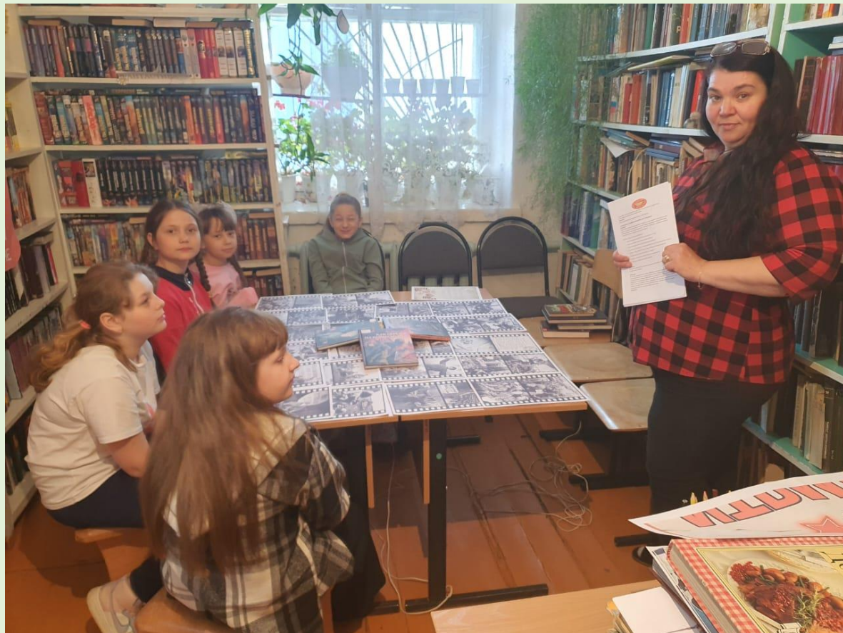
Громкие чтения «Как Серёжка на войну ходил» с. Октябрьский