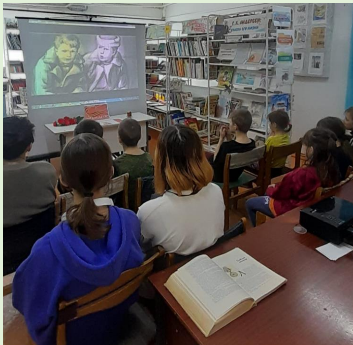
Час памяти «В сердцах и книгах память о войне» с. Чалбачи