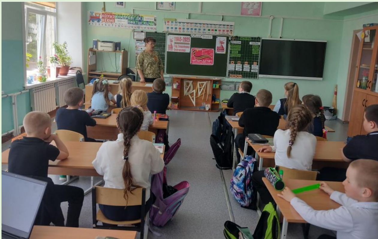
Громкие чтения «О войне мы из книжек у знали» п. Горный