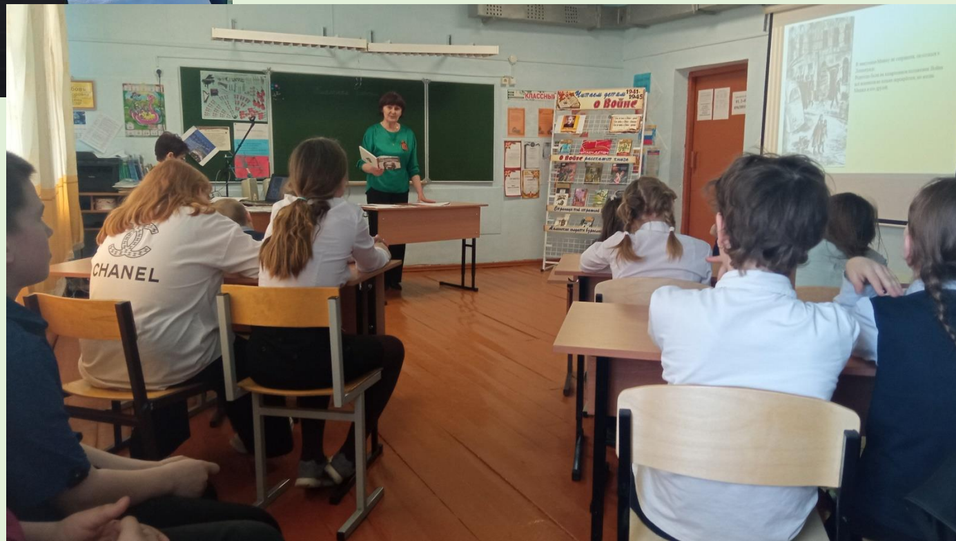
Час памяти «Читать, чтобы помнить» с. Гулик