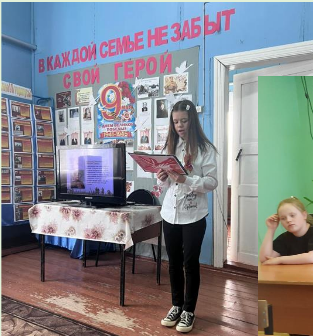
Литературный час «И память о войне нам книга оставляет» с. Поляковский