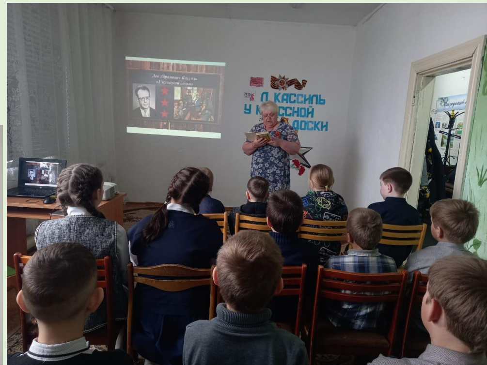
Громкие чтения «Война и судьбы» с. Овсянка