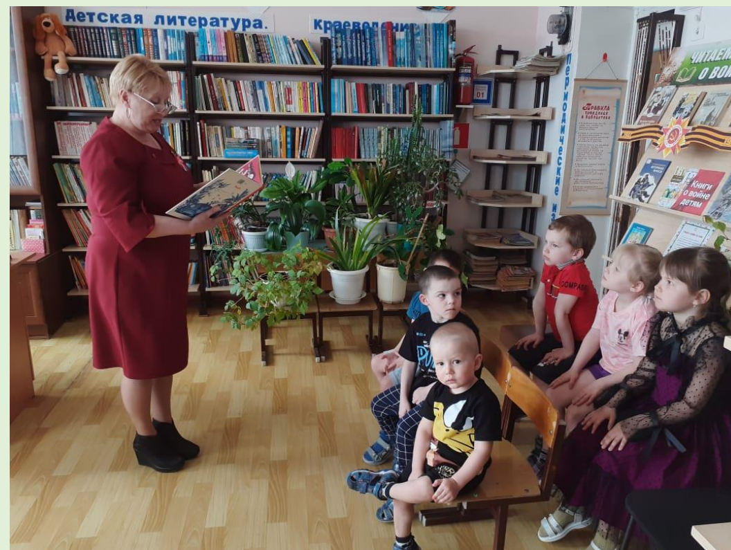
Громкие чтения «Читаем солдатскую сказку» п. Огорон