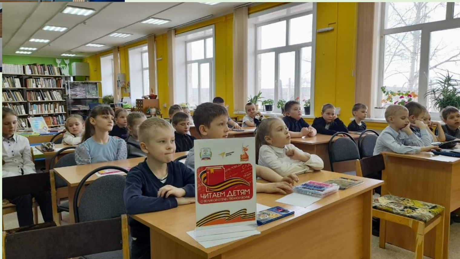
Час памяти «Войны священные страницы» с. Сосновый Бор