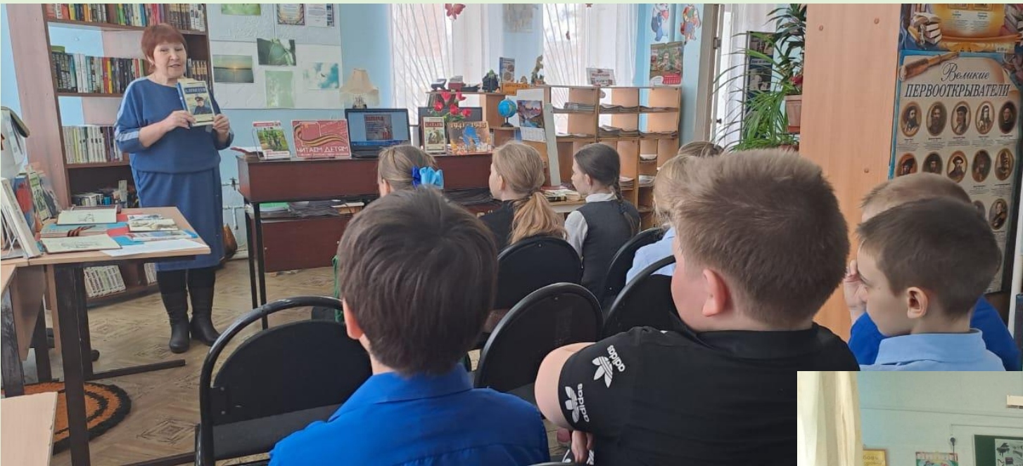
Урок памяти «Бессмертный подвиг» п. Верхнезейск