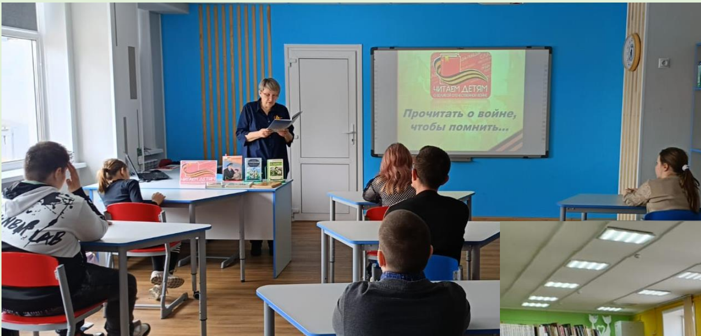
Литературный час «Прочитать о войне, чтобы помнить» п. Тунгала