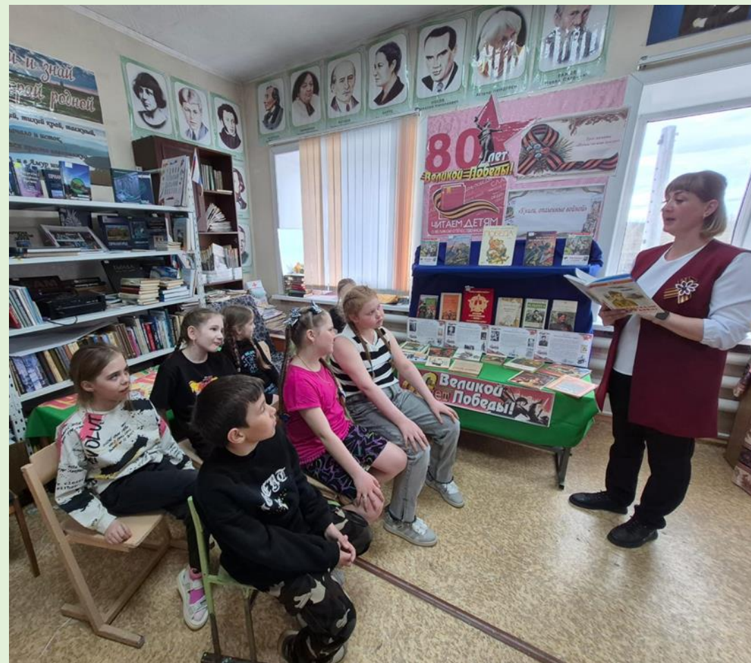
Урок памяти «Подвиг во имя жизни» п. Дугда