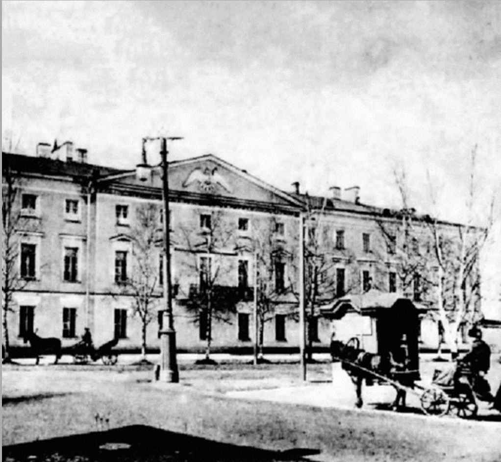
Гатчинский Сиротский институт

Писать стихи начал, будучи воспитанником Сиротского института. В ноябре 1887 года им было написано стихотворное приветствие императрице по случаю посещения ею Сиротского института в день его пятидесятилетия.