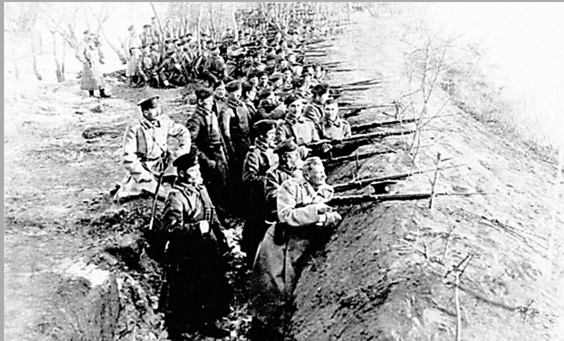
Оборона Благовещенска, июль 1900 год

Жизнь молодого тридцатилетнего поэта оборвалась 21 июля 1900 года во время вооруженного конфликта России и Китая. Русские войска в ответ на обстрел и осаду Благовещенска в ночь на 20 июля переправились на правый берег Амура, 21-го переправлялись по направлению к Айгуну, но натолкнулись на хорошо укрепленную позицию противника. На этой позиции во время атаки погиб Леонид Волков, командовавший 4-й сотней Амурского казачьего полка.