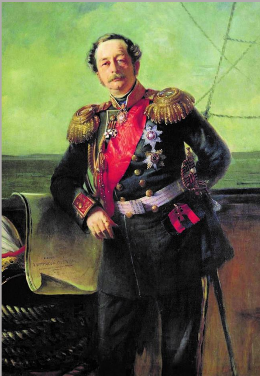
Граф Н.Н. Муравьев-Амурский

Мы твёрдо стали на Амуре, Вошли в открытый океан, Флаг русский поднят в Порт-Артуре И отдан нам Талменван. Здесь помнят графа Муравьева!.. Ещё недавно жил Сизой, Носитель истинного слова И первый пастырь городской.