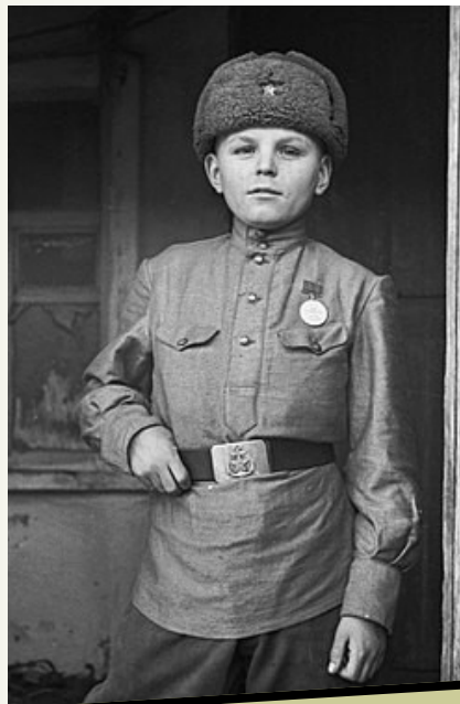
Сын полка, РККА, 1943

Замысел повести «Сын полка» начал формироваться у Катаева в 1943 году, когда он работал фронтовым корреспондентом и постоянно перемещался из одного воинского соединения в другое. Однажды писатель заметил мальчика, облачённого в солдатскую форму: гимнастёрка, галифе и сапоги были самыми настоящими, но сшитыми специально на ребёнка. Из разговора с командиром Катаев узнал, что мальчуган - голодного, злого и одичавшего - разведчики нашли в блиндаже. Ребёнка забрали в часть, где он прижился и стал своим. Позже писатель ещё не раз сталкивался с подобными историями.