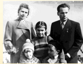
Калашников с женой и детьми 1959 год

Автомат и его модификации состоят на вооружении более 100 стран мира, суммарное количество автоматов Калашникова превышает 100 млн единиц, из-за чего АК включили в Книгу рекордов Гиннеса.