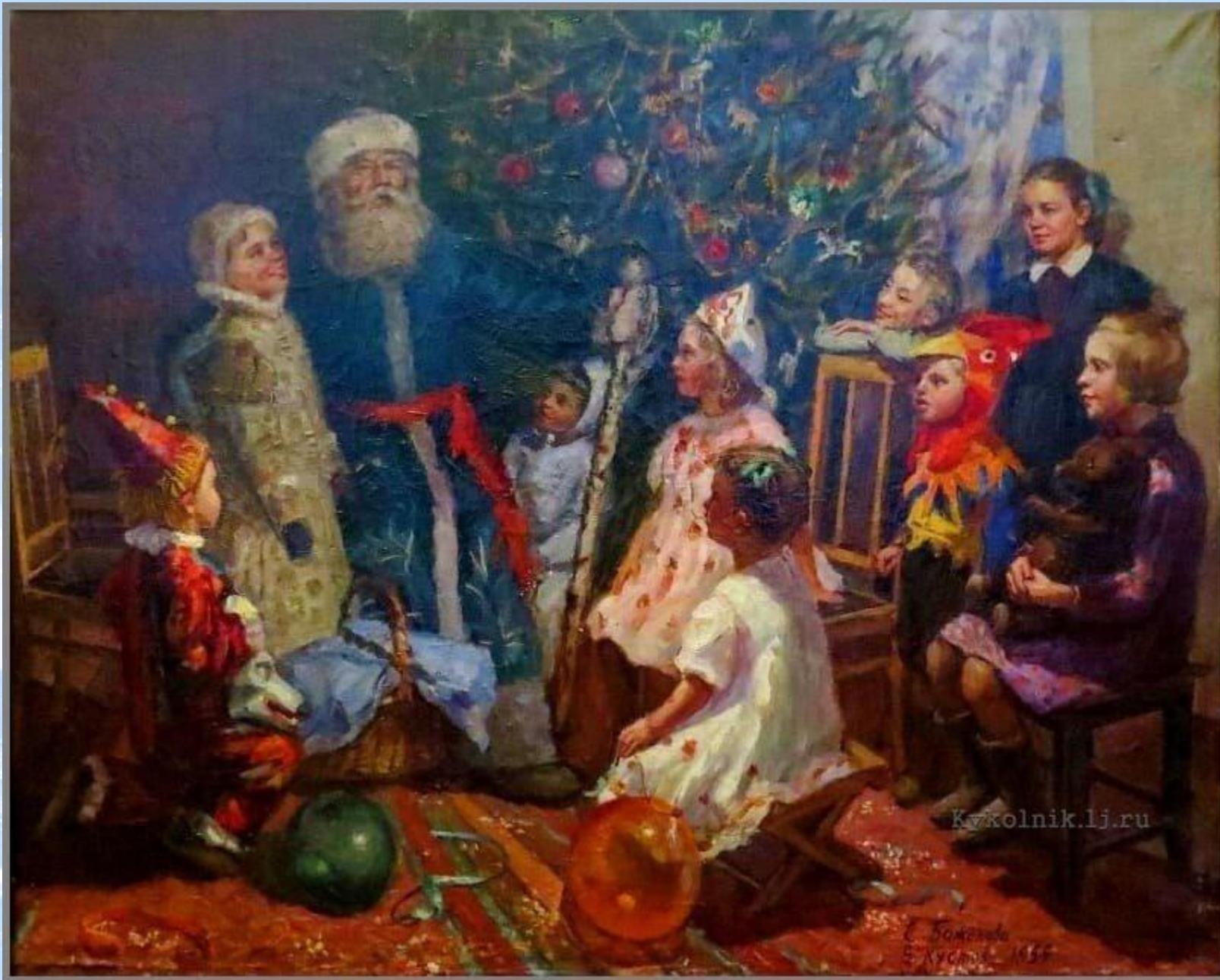
Борис Кустов. Сказки Дедушки Мороза. 1955