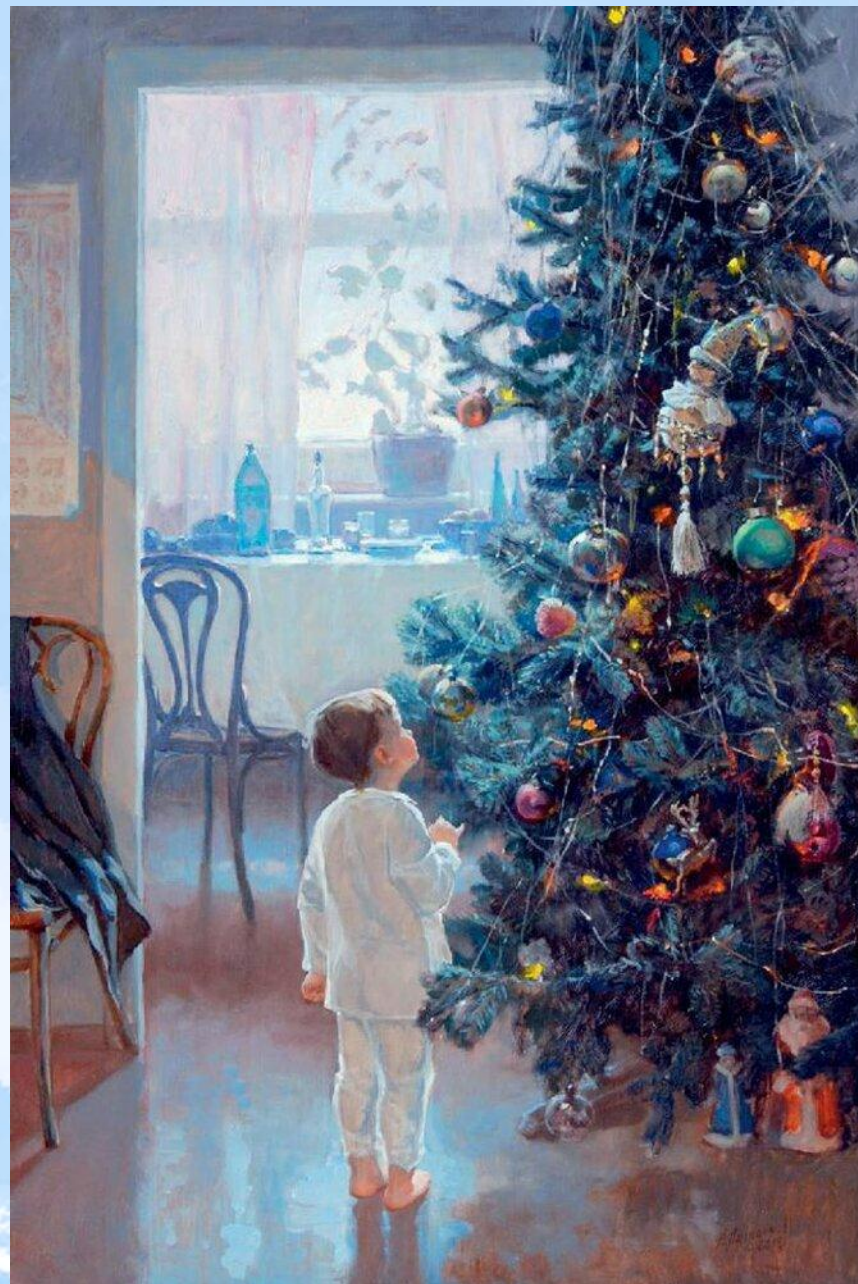
Александр Левченков. Утро Нового года. 1999