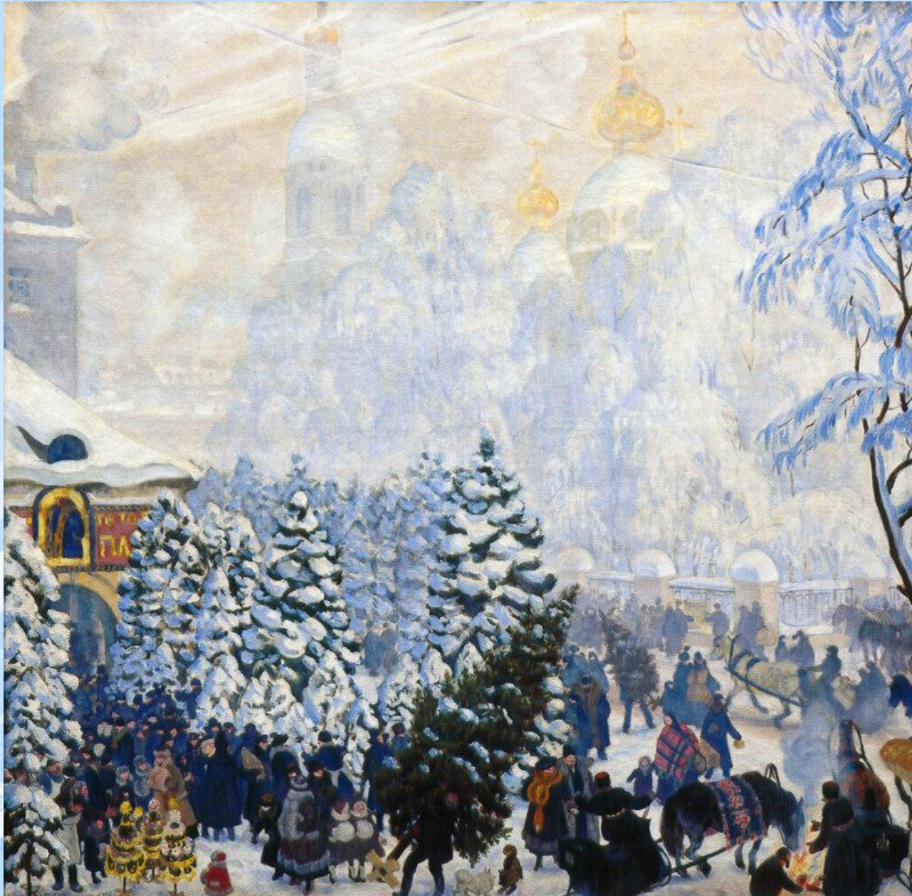
Борис Кустодиев. Ёлочный торг. 1918

В 2024 году новогодней ёлке исполнится 325 лет. Согласно указу Петра Первого от 1699 года в день «новолетия, 1 января было велено пускать ракеты, зажигать огни, украшать столицу хвоей».