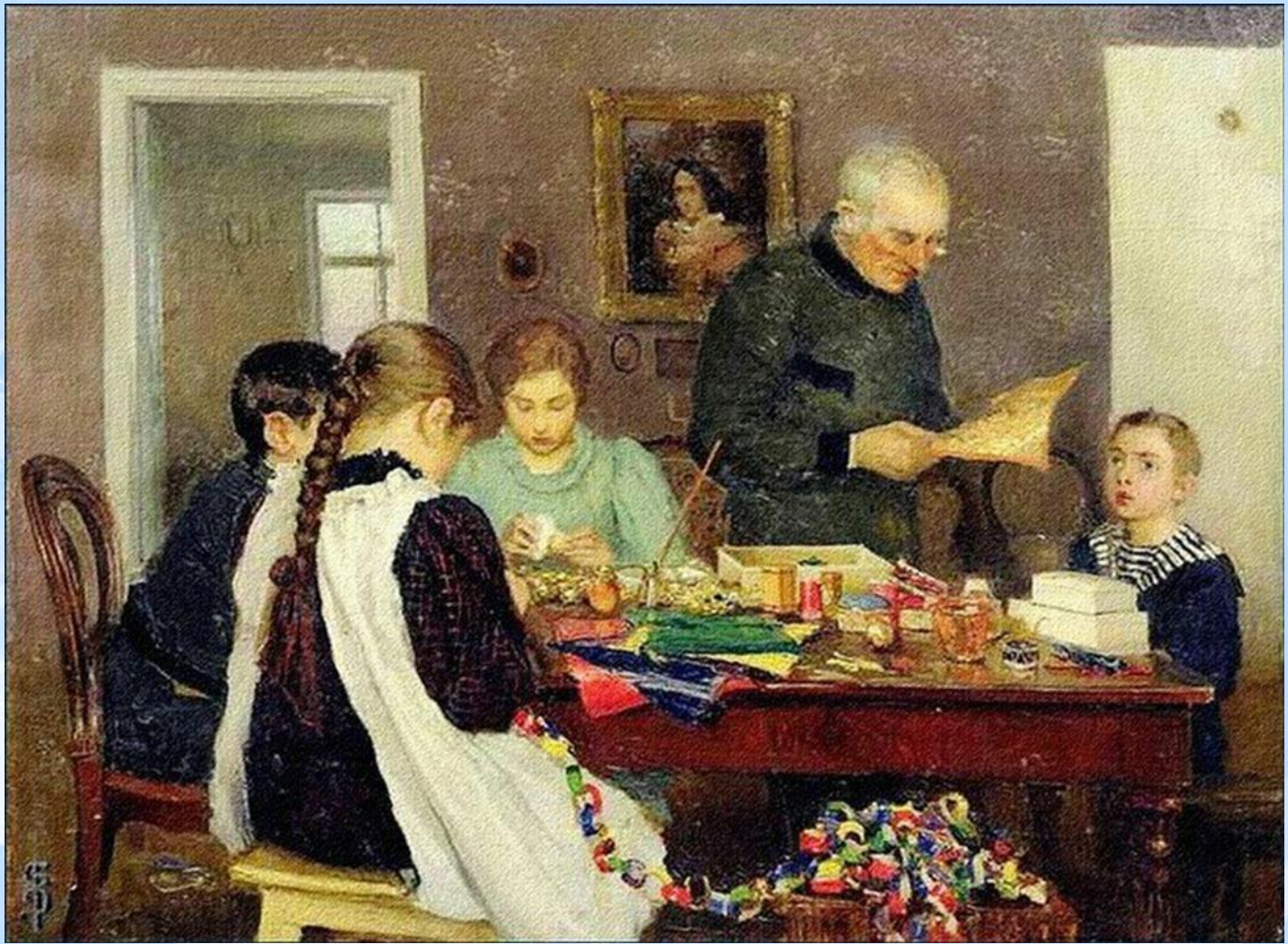
Сергей Досекин. Подготовка к Рождеству. 1896

Позже украшения стали сказочными: позолоченные шишки, коробочки с сюрпризами, сладости, орехи и горящие рождественские свечи. Вскоре добавились игрушки, сделанные своими руками: дети и взрослые мастерили их из воска, картона, ваты и фольги. А в конце XIX века на смену восковым свечам пришли электрические гирлянды.