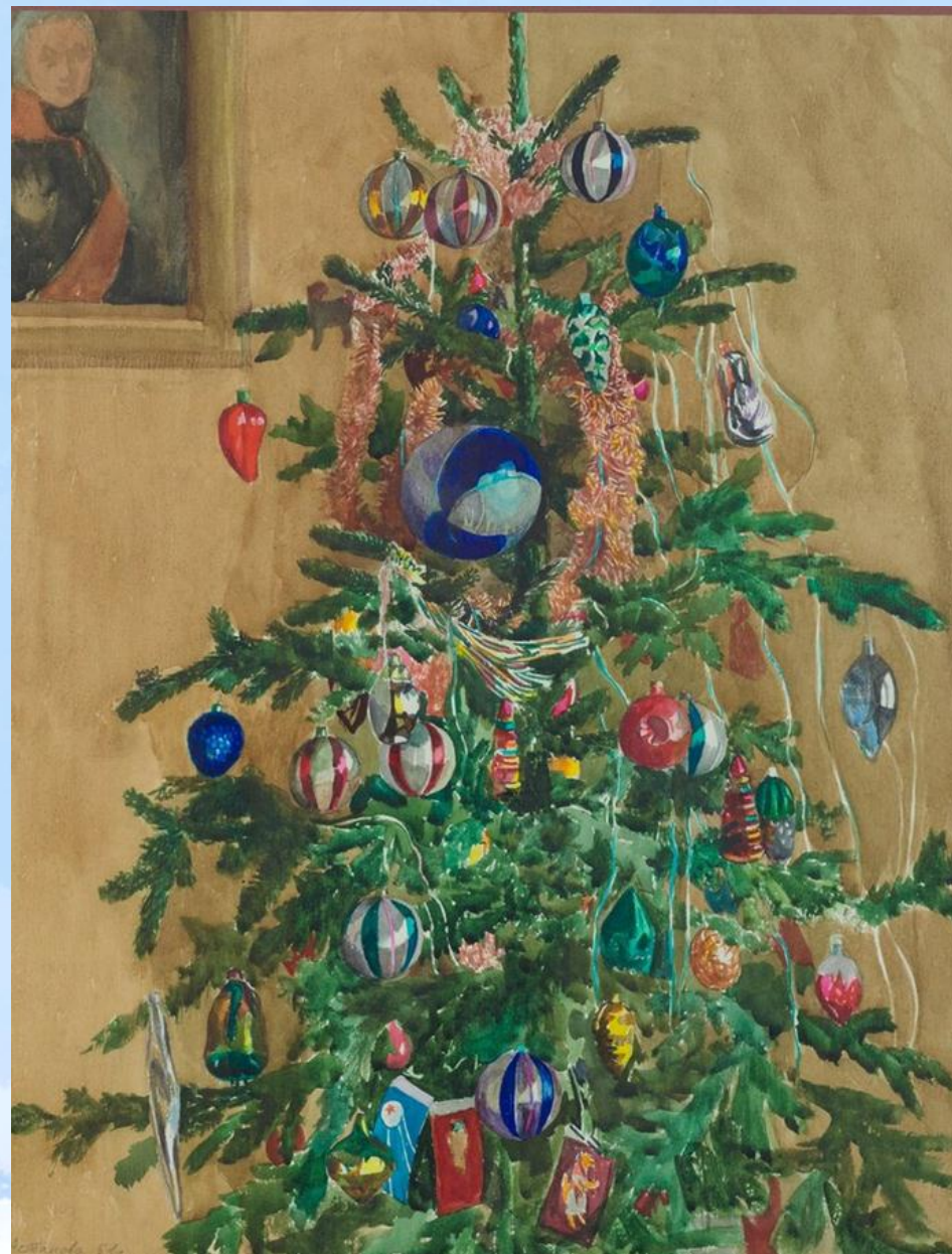
Дебора Астапова. Новогодняя елка. 1961