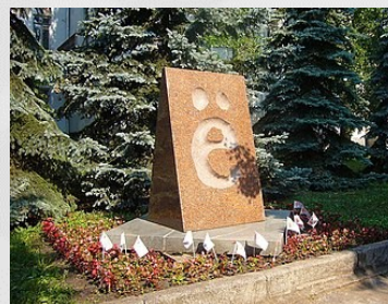
Памятник букве «ё» в Ульяновске

В 2000-е годы «ё» стали защищать: вышло несколько крупных исследований о ее появлении, а в Ульяновске появился памятник самой молодой букве русского алфавита.