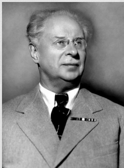
Владимир Петрович Потёмкин

Частью нормативного алфавита буква стала в 1942 году. Народный комиссар просвещения РСФСР Владимир Потемкин приказал обязательно