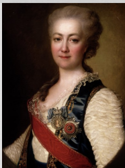
Княгиня Е. Р. Воронцова- Дашкова

В доме директора Петербургской академии наук княгини Екатерины Романовны Дашковой 18 (29) ноября 1783