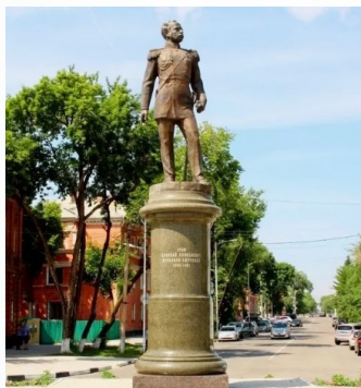
Памятник Муравьеву-Амурскому в Благовещенске

Бывший губернатор Восточной Сибири умер в Париже 18 ноября 1881 года и был похоронен на Монмартрском кладбище. Но с 1991 года прах великого патриота России покоится во Владивостоке на полуострове, носящем имя Муравьева-Амурского.