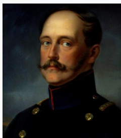
Император Николай I

Здесь он научился вести сложные дипломатические переговоры. За годы службы на Кавказе Н.Н. Муравьев дважды представлялся к наградам, повышался в чине и в 32 года стал генералом. Покинув Кавказ в 1844 году, Н.Н. Муравьев некоторое время лечился после ранения на водах в Европе, затем в июле 1846 года был назначен на пост тульского губернатора. К этому времени относится его письмо к Николаю I, в котором он убеждал царя отменить крепостное право, наделив крестьян землей. 5 сентября 1847 года, проезжая через Тулу, Николай I объявил Муравьеву о назначении его исполняющим должность иркутского и енисейского генерал-губернатора, командующим войсками, расположенными в Восточной Сибири. Это событие вызвало в Петербурге удивление,