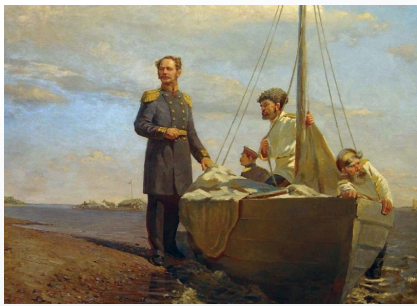
«Приезд Муравьева в Усть-Зейский пост в 1857 г.». Художник – Е.П. Санаев.

В числе участников сплавов были экспедиции ученых географов, картографов, геодезистов, натуралистов, этнографов. Среди них было немало членов только что созданного в