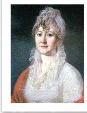
Бабушка Лермонтова. Елизавета Арсеньева.

Будущий поэт почти всё детство проболел золотухой.