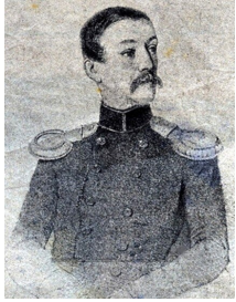
Николай Соломонович Мартинов

Михаил Юрьевич то и дело отпускал неуместные шутки, стараясь задеть приятеля. Не выдержав насмешек, Николай вызвал его на дуэль. Всерьёз их ссору никто не воспринял, как и сам Михаил — он выстрелил вверх. Но обиженный противник не проявил ответное великодушие.