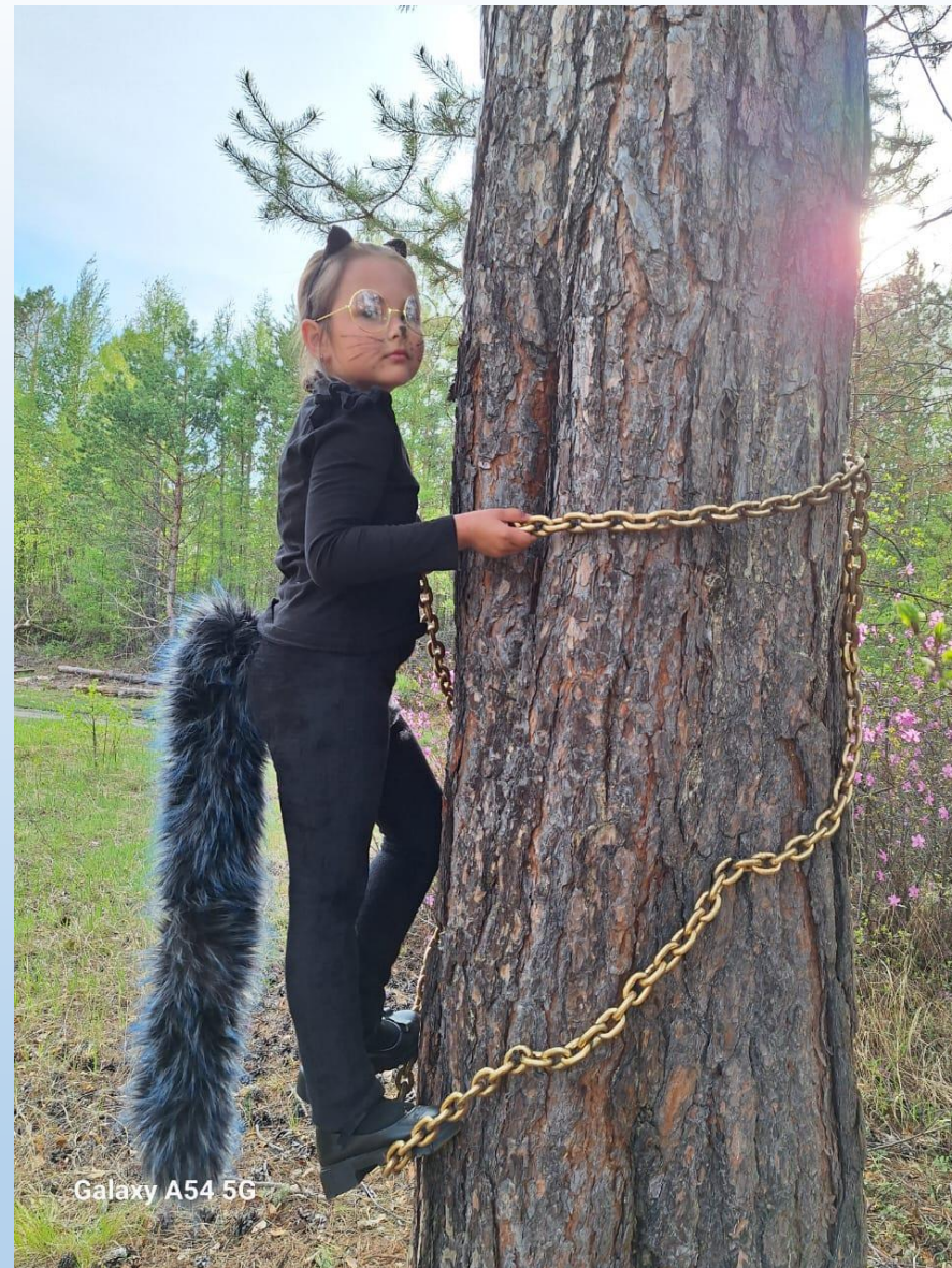
Автор: Кондратенко Евгения «Руслан и Людмила» Кот ученый: Кондратенко Софья п. Береговой