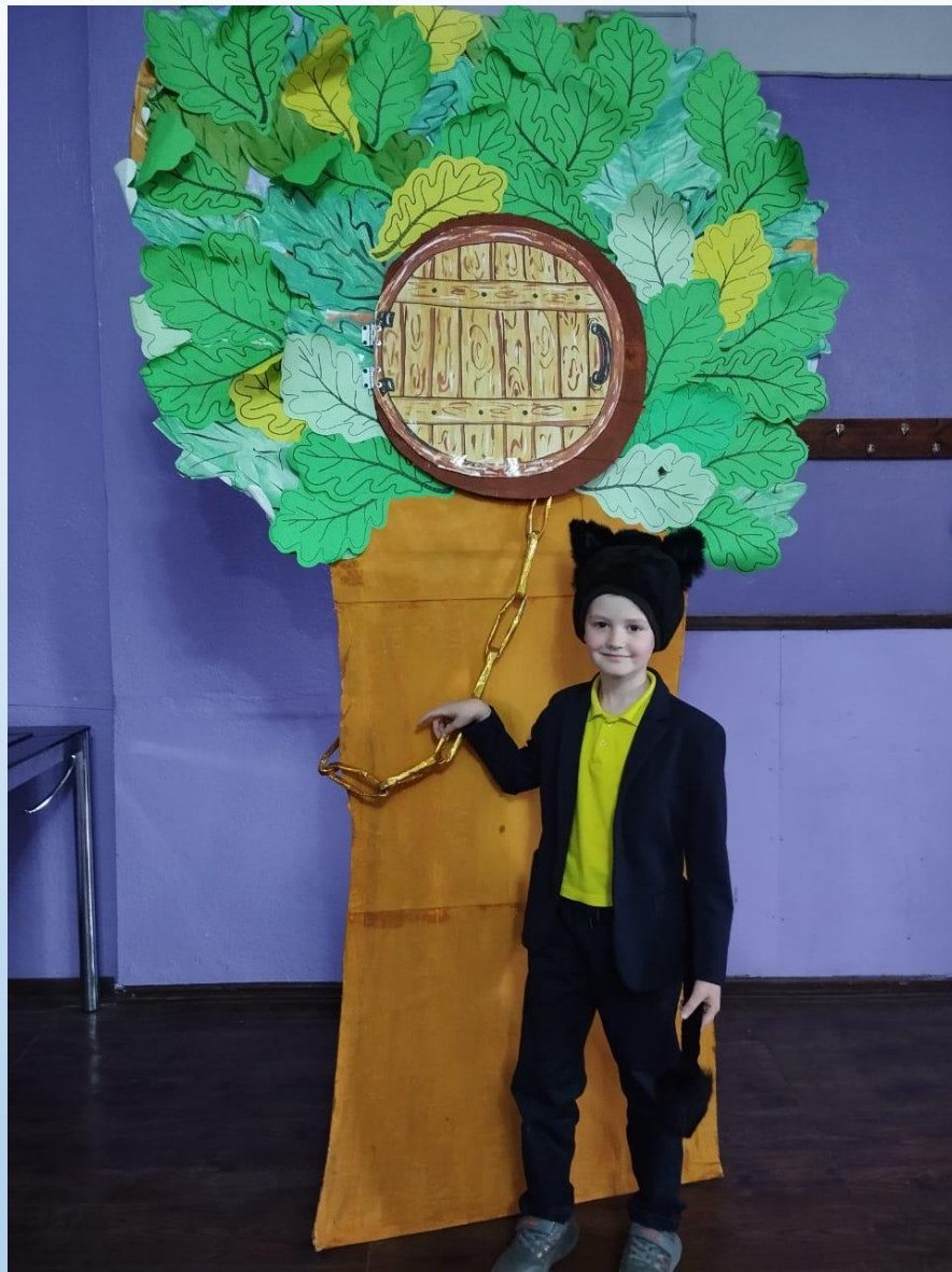
Автор: Мазуренко Оксана «Руслан и Людмила» Кот ученый: Мазуренко Андрей п. Береговой

У лукаморья дуб зелёный; Златая цепь на дубе том: И днём и ночью кот учёный Всё ходит по цепи кругом;