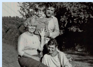
Искандер с женой и детьми