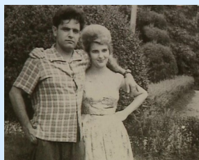
Искандер с женой