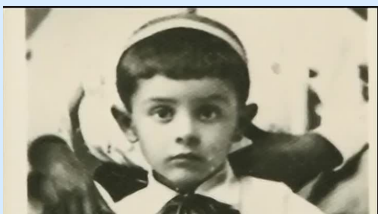
Фазиль Искандер в детстве