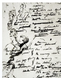
Рукопись А.С. Пушкина

За время написания романа А.С. Пушкин успел начать и закончить работу над «Борисом Годуновым», совершил путешествие по Военно-Грузинской дороге, побывать в Одессе и сделать предложение Наталье Гончаровой.