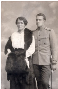
И. Шмелёв с женой

Шмелёв отправил текст в журнал «Русское обозрение», его приняли, но с публикацией не торопились. «У мельницы» вышел на страницах издания только через год. Рассказ стал первым опубликованным произведением Ивана Шмелёва.