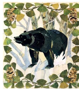
Фрагменты мозаичного панно «Поэма о Приамурье»

Площадь картины 12 квадратных метров. Г. Д. Павлишину в своем произведении удалось схватить и отразить самую характерную особенность природы Приамурья — сосуществование на одной территории северных и южных растений и животных. В мозаичной картине мы видим лиственницу и виноград, маньчжурский орех и березу, северного оленя и тигра, гималайского медведя и кабарожку. Богат и разнообразен животный мир первобытных дальневосточных лесов, но художник выбрал из него самых типичных представителей, придав им характерные, динамичные позы.