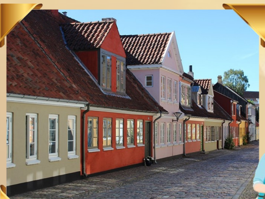
Одна из старинных улиц в городе Оденсе

Ганс Христиан Андерсен родился 2 апреля 1805 года в городе Оденсе, в Дании.