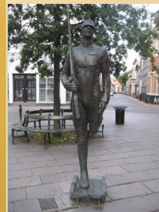
Памятник оловянному солдатiku

На улицах города Оденс можно найти множество памятников и героям сказок Андерсена. Стойкий оловянный солдатик охраняет покой горожан на краю старого квартала. На городской площади, гордо выпятив грудь, стоит он на небольшой тележке.