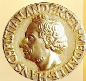
Медаль к премии Г.Х. Андерсена

Этой наградой были награждены известные детские писатели: