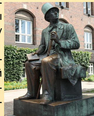
Памятник Г.Х. Андерсену

Бронзовый Андерсен на Ратушной площади Копенгагена задумчиво смотрит на парк Тиволи.